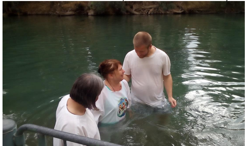
Obnova křtu v Jordánu