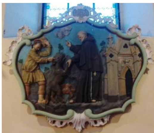
(dole: rokokové malby sv. Dominika a sv. Františka na stěnách ledeckého kostela)