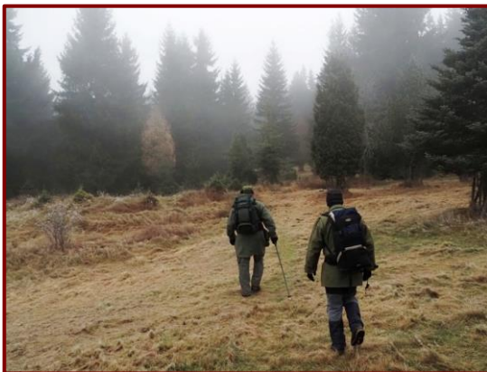
(Snímky: vandr na Brdy 22. 11. 2023.)